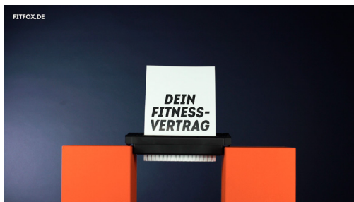
TV / YouTube